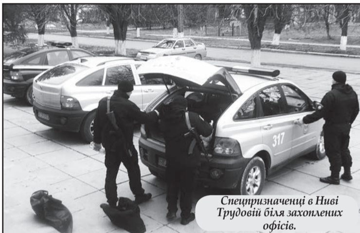
Специризначенці в Ниві Трудовій біля захопленого офісів.

дів схиляють саме до такої думки. Де рішучі зміни, про які ще з часів Революції Гідності криком кричить українське суспільство? А з 17 жовтня вимоги про них щодня лунають на Майдані під Верховною Радою.